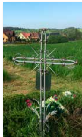
Stan aktualny. Krzyż przeniesiony z sygnaturki kościoła w Lipnicy Małej w 2018 r.