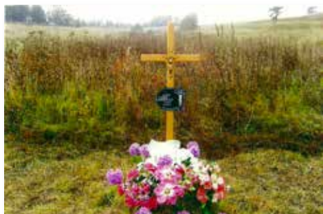
Krzyż w latach 2000-2010 r.