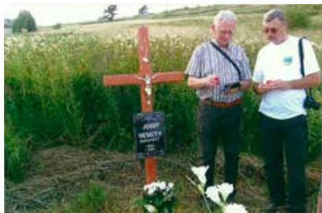
Krzyż w latach 2010-2018. Osoby na zdjęciu to przedstawiciele gminy Nagymanyok

Armia oraz 1. Armia Gwardii, szybko posuwały się na zachód, wyzwalając 29. stycznia Nowy Targ. Jeszcze tego samego dnia formacje radzieckie przekroczyły Dunajec. 30 stycznia 1945r. Niemcy zostali wyparci z Orawy. Węgierscy żołnierze walczący po stronie Niemiec kierując się w stronę dzisiej-