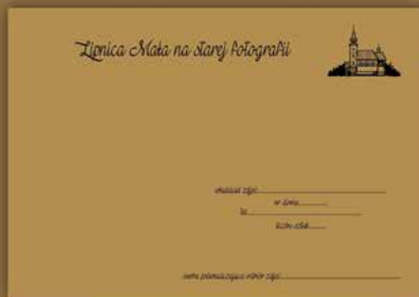
Koperta w której będą przechowywane zdjęcia

Podczas procesu skanowania jak również przy odbiorze i oddaniu właścicielowi zdjęć będzie zachowana największa ostrożność.