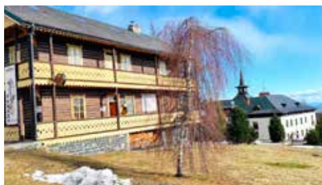
Hrebienok - Smokowieckie Siodelko „Słowacka Gubałówka”