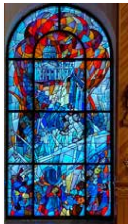
Wotum wdzięczności ocalenie życia Ojca Świętego Jana Pawła II