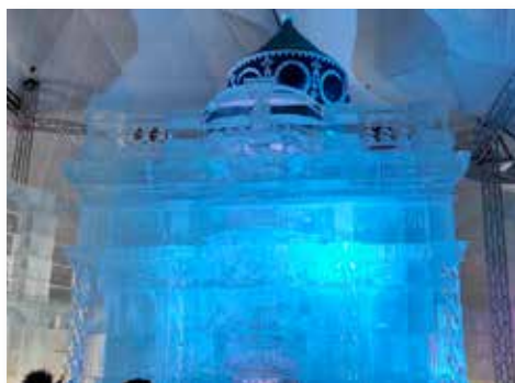
Tatry Wysokie Tatrzańska Świątynia Lodowa /wykonana z 1880 bloków lodu replika Bazyliki Grobu Pańskiego w Jerozolimie