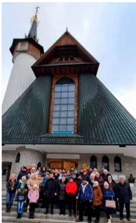
Zakopane Krzeptówki - Polska Fatima