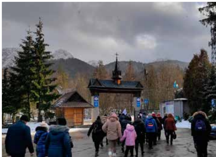
Narodowe Sanktuarium Matki Bożej Fatimskiej